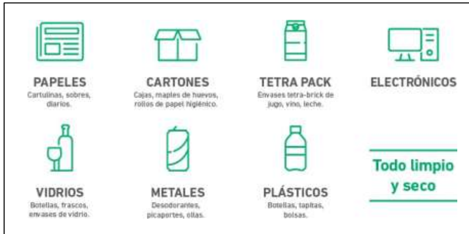
Figura 6. Residuos aprovechables.

Aprovechables. Es cualquier material, objeto, sustancia o elemento sólido que no tiene valor de uso directo o indirecto para quien lo genere, pero que es susceptible de incorporación a un proceso productivo. Entre estos residuos se encuentran: algunos papeles y plásticos, chatarra, vidrio, telas, partes y equipos obsoletos o en desuso, entre otros.