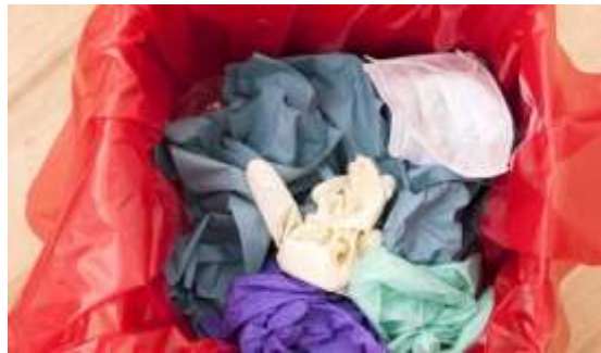
Figura 9. Residuos de riesgo biológico.

Residuos infecciosos o de riesgo biológico. Son aquellos que contienen microorganismos patógenos tales como bacterias, parásitos, virus, hongos, virus oncogénicos y recombinantes como sus toxinas, con el suficiente grado de virulencia y concentración que pueda producir una enfermedad infecciosa en huéspedes susceptibles.