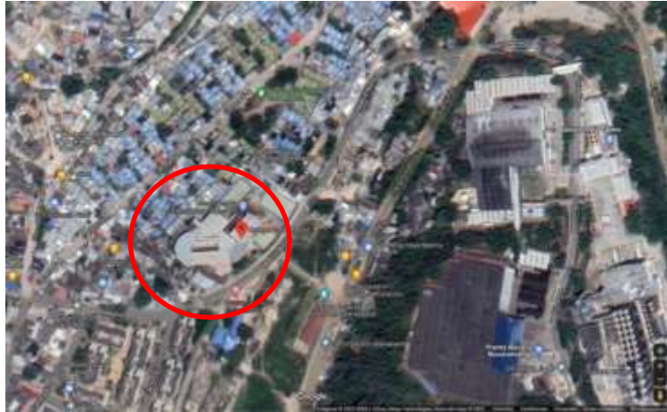
Figura 3. Ubicación Subestación Chimita Zona Industrial de Bomberos de Bucaramanga.