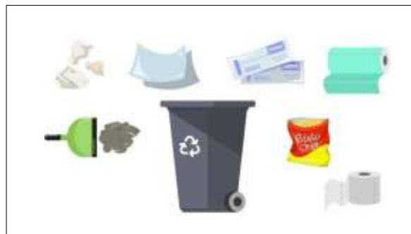
Figura 7. Residuos ordinarios o comunes.

No aprovechables. Es todo material o sustancia sólida o semisólida de origen orgánico e inorgánico, putrescible o no, proveniente de actividades domésticas, industriales, comerciales, institucionales, de servicios, que no ofrece ninguna posibilidad de aprovechamiento, reutilización o reincorporación en un proceso productivo. Son residuos sólidos que no tienen ningún valor comercial, requieren tratamiento y disposición final y por lo tanto generan costos de disposición.