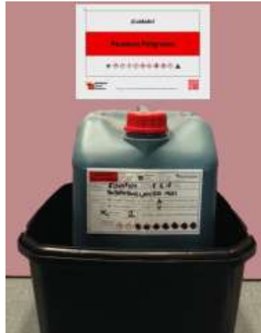
Figura 10. Residuos químicos.

RAEE. Los aparatos eléctricos y electrónicos (AEE) son productos que están presentes en prácticamente toda nuestra vida cotidiana y están conformados por una combinación de piezas o elementos que para funcionar necesitan corriente eléctrica o campos electromagnéticos y realizan un sinnúmero de trabajos y funciones determinadas. En el momento en que sus dueños consideran que no les son útiles y los descartan, se convierten en residuos de aparatos eléctricos y electrónicos (RAEE). Estas categorías son: aparatos de intercambio de temperatura, pantallas y monitores, lámparas, grandes y pequeños aparatos, y aparatos de informática y telecomunicaciones.