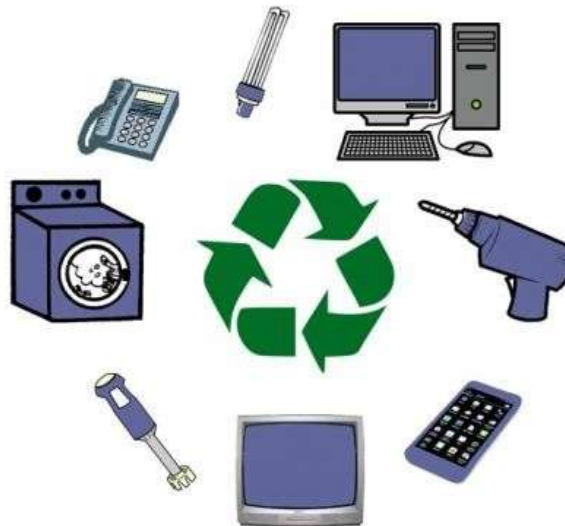
Figura 11. Residuos AEE.

RAEE. Los aparatos eléctricos y electrónicos (AEE) son productos que están presentes en prácticamente toda nuestra vida cotidiana y están conformados por una combinación de piezas o elementos que para funcionar necesitan corriente eléctrica o campos electromagnéticos y realizan un sinnúmero de trabajos y funciones determinadas. En el momento en que sus dueños consideran que no les son útiles y los descartan, se convierten en residuos de aparatos eléctricos y electrónicos (RAEE). Estas categorías son: aparatos de intercambio de temperatura, pantallas y monitores, lámparas, grandes y pequeños aparatos, y aparatos de informática y telecomunicaciones.