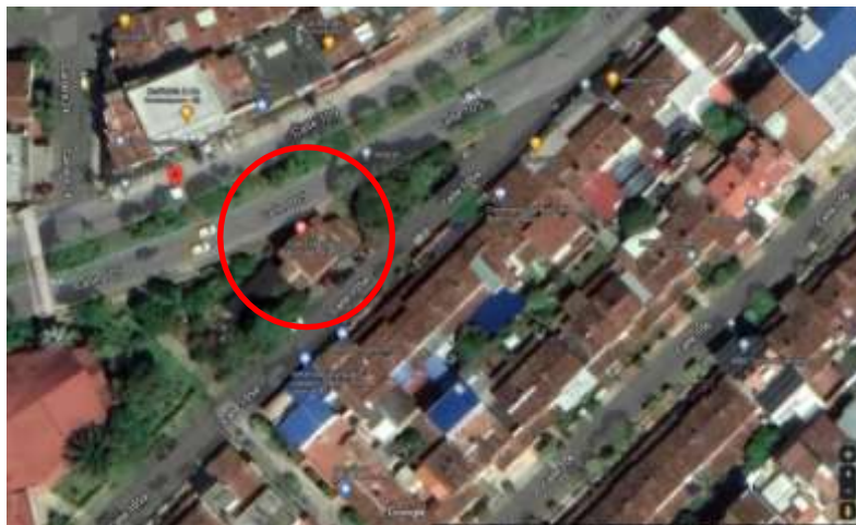
Figura 2. Ubicación Subestación Provenza de Bomberos de Bucaramanga.