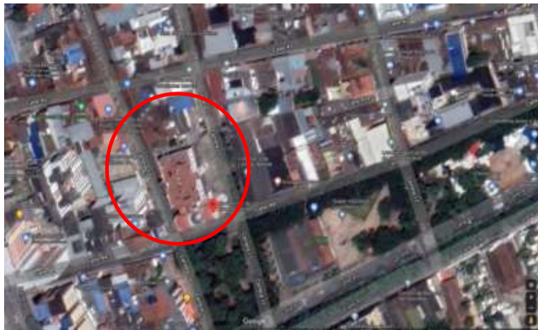
Figura 1. Ubicación Sede administrativa y estación central de Bomberos de Bucaramanga.