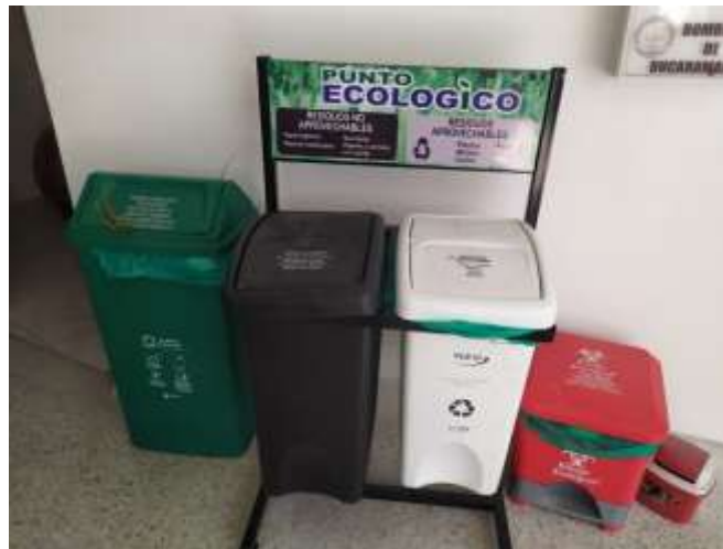
Figura 4. Punto ecológico en la estación central de Bomberos de Bucaramanga.

En la sede central de Bomberos de Bucaramanga se encuentran ubicados cuatro (4) puntos ecológicos cuya ubicación actual son: el primer piso, al lado de la entrada al área de operaciones, en el segundo piso, al lado de las escaleras de acceso al tercer piso, en el área de operaciones, al lado de la oficina de oficiales y un punto ecológico más por cada estación, en donde se realiza la clasificación de los residuos sólidos generados por el personal de Bomberos de Bucaramanga.