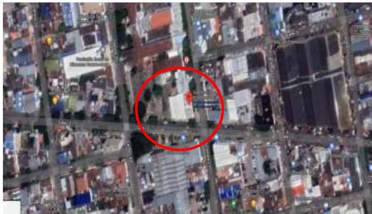
Figura 4. Ubicación Subestación mutualidad de Bomberos de Bucaramanga.