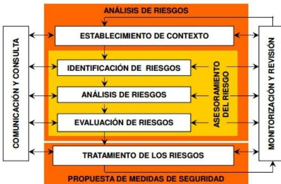
Figura 1 Proceso para la administración del riesgo.